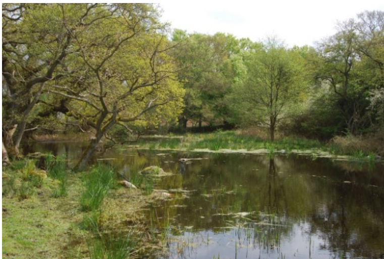
Billede1. § 3-beskyttet sø.

Vurderer kommunen, at der er tale om beskyttet natur, er det en konkret afgørelse, som er retlig bindende for lodsejere og andre, og træder i stedet for den vejledende registrering, se bl.a. NMK-510-00212 . Lodsejeren har, efter forvaltningslovens regler, krav på partshøring, inden kommunen meddeler sin afgørelse. En afgørelse kan påklages til Miljø- og Fødevareklagenævnet af ejeren/brugeren af arealet. Danmarks Naturfredningsforening og lignende interesseorganisation samt naboer kan ikke påklage afgørelsen, heller ikke selv om afgørelsen går ud på, at der ikke er tale om et beskyttet areal.